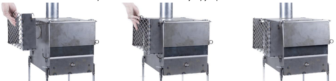
Kuva 5. Kivitelineiden asennus