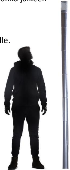
Kuva 4. Kamiinan savutorvi

7. Varmista, että kamiina seisoo tukevasti eikä pääse kaatumaan. Tue kamiina tarvittaessa tai siirrä hieman parempaan kohtaan savutorven mahdollistamissa rajoissa. Huomioi talvella, että kamiinan alla oleva lumi ja jäätyneet maa sulavat ja kamiina saattaa päästä kallistumaan lämmityksen edetessä.