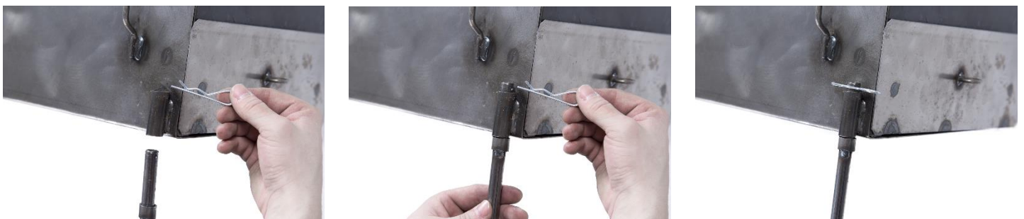
Kuva 3. Telttakamiinan jalan asentaminen kamiinaan